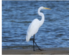
Garza Blanca (Garza Real) Ardea alba

- Tus observaciones ayudan a que entendamos las poblaciones de aves de tu región.