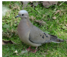
Torcaza (Paloma Torcaza) Zenaida auriculata