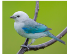
Tangara Azulgris (Azulejo) Thraupis episcopus