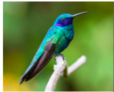
Colibrí Grande (Colibrí chillón) Colibri coruscans