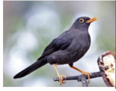
Paraulata Morera (Mirla Patianaranjada) Turdus fuscater