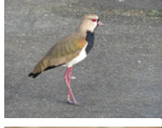
Avefría Tero (Alcaraván) Vanellus chilensis