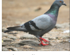
Paloma Doméstica Columba livia