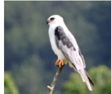
Milano Cola Blanca (Gavilan Bailarín, Maromero) Elanus leucurus