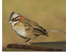
Gorrión Chingolo (Copetón) Zonotrichia capensis