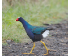
Gallineta Morada (Tingua azul) Porphyrio martinica