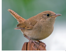
Saltapared Común (Cucarachero común) Troglodytes aedon