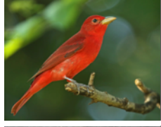
Piranga Roja (Tangara Veranera) Piranga rubra