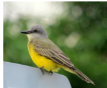
Tirano Pirirí (Sirirí) Tyrannus melancholicus